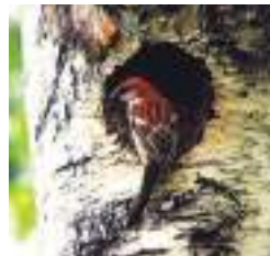
ニュウナイスズメ(雄)

漂鳥。多雪地帯のブナ林を代表する鳥。フィーチョチョ、フィーチョチョと大きな声で囀る。局所分布する珍しい種類。