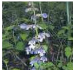
ラショウモンカズラ

多年草。多雪地の少し湿ったところに群生することが多い。花は黄色で直径1.5~2cmで、草丈15~30cmになる大形のスミレ。